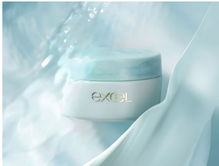
サナ エクセル デイスキコンフォート ハイドレーティング

◆2026年6月2日よりエクセル公式オンラインショップ、Amazonにて先行販売いたします。