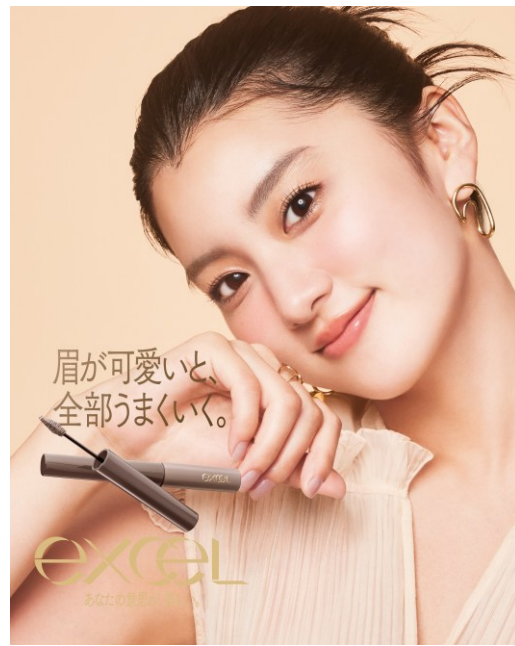
サナ エクセル フェードブロウマスカラ F B 0 1～F B 0 4

「フェードブロウマスカラ」は、 眉マスカラが苦手な方でも簡単に使える、ふんわり軽やかな仕上がりを叶える“失敗知らず”の眉マスカラ です。液が付きすぎたり、ムラになったりしやすい眉マスカラの不満点を見直し、 誰でも自然で抜け感のある眉に仕上げます。