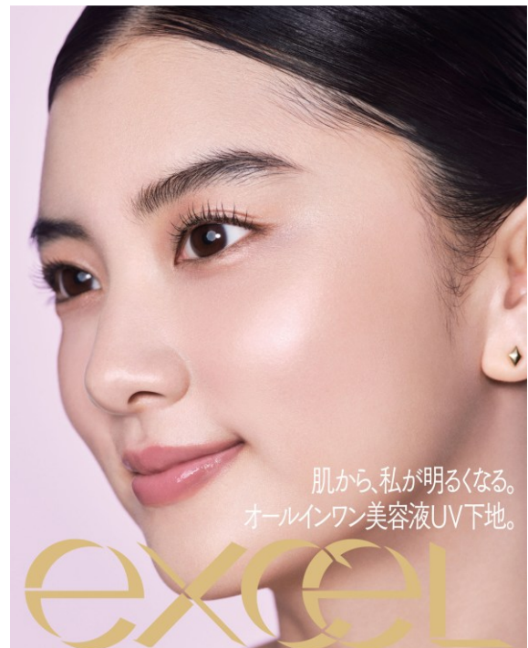
サナ エクセル モチベートユアスキン MT02（ラベンダーピンク）

エクセルでは2025年秋より新コンセプト「あなたの意思が、美しい。」を掲げ、「自分らしく美しくありたい」と願う人に、自分を信じる力をくれる”ブランドへアップデート。ベースメイクアイテムは、「隠す”ではなく”活かす”」をテーマに、自分本来の美しさを引き出し活かす製品をお届けします。