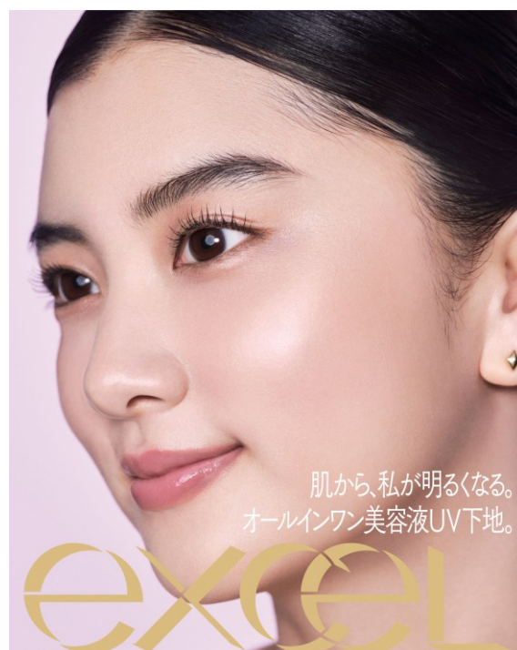
サナ エクセル モチベートユアスキン MT02（ラベンダーピンク）

エクセルでは 2025 年秋より新コンセプト「あなたの意思が、美しい。」を掲げ、“自分らしく美しくありたい”と願う人に、自分を信じる力をくれる”ブランドへアップデート。ベースメイクアイテムは、“隠す”ではなく”活かす”をテーマに、自分本来の美しさを引き出し活かす製品をお届けします。