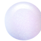
サナ エクセル リップケアオイル LO05 (アイシーダズル) ※現在は販売していません。