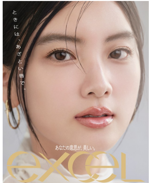
サナ エクセル パンプフルドロップ FD01～FD04

「パンプフルドロップ」は むっちりとしたボリューム唇* を叶えるトリートメントグロスです。チューブタイプならではの厚みのあるテクスチャーで、縦じわをカバーし、ぷるんとした立体感を演出します。