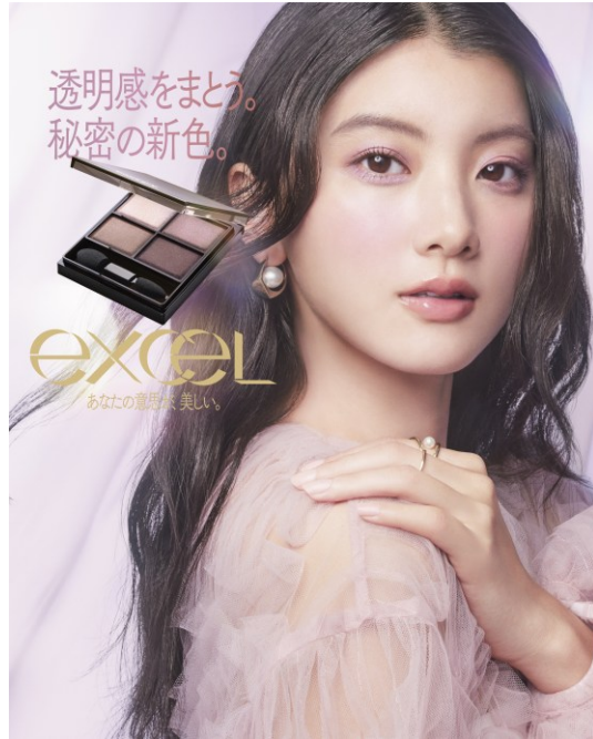
サナ エクセル スキニーリッチシャドウ N SK08

2026年2月にリニューアル発売した「スキニーリッチシャドウ N」は、ブランドの看板アイテム「スキニーリッチシャドウ」の色展開・ツヤ感・密着力をすべてアップデートさせた新アイシャドウ。リニューアルでは、パレットの4色それぞれの美しさや発色、濃淡までを徹底的に見直し、グラデーションだけではなく、もっと自由にメイクを楽しめるアイシャドウへと進化しました。