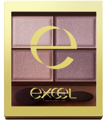
エクセル スキニーリッチシャドウ SR14（クラッシィブラウン）

「SR14（クラッシィブラウン）」の、青みとブラウンの程良いバランスをベースに、左下のまろやかなピンクブラウンを深みのあるトープブラウンに調整。透明感のある上品なカラーに仕上げました。