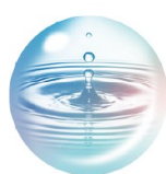
グリシルグリシン ※4