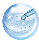
ナイアシンアミド