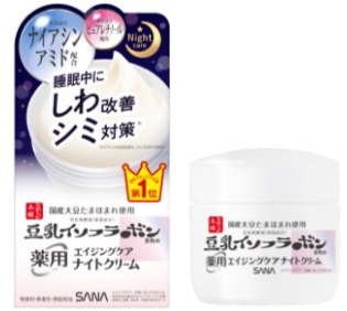
サナ なめらか本舗 薬用リンクルナイトクリーム ホワイト

また夜間ケア用アイテムでケアしたい悩みを調査したところ、「ニキビ」「乾燥」「毛穴」が上位挙がっていることがわかりました *4 。そこで 肌荒れ防止&毛穴ケア ※1 ができ、皮脂悩みの多い混合肌・脂性肌の多い *5 10代・20代も使いやすいべたつかないジェルパックを開発いたしました。