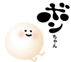
なめらか本舗キャラクター ボンちゃん

■サナ オンラインショップ： https://noevirgroup.jp/sana/