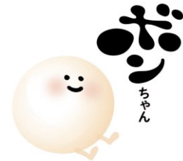
なめらか本舗キャラクター ボンちゃん

■サナ オンラインショップ： https://noevirgroup.jp/sana/