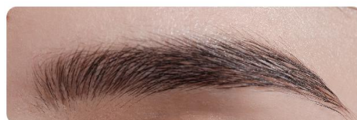
〈仕上がりイメージ〉