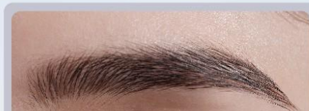
〈仕上がりイメージ〉