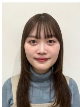
『サナ ニューボーン』