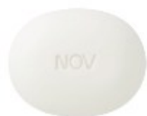
ピーリング洗顔料

ノブプラスは、古い角質をとりのぞくだけでなく、その後のお手入れも、とても大切にしています。 古い角質をとりのぞき角層をやわらかくととのえ、アミノ酸 ※1 やビタミン ※2 などの保湿成分を補給し、 お肌を保護します。このステップは、美容皮膚科学研究の知見から生まれました。