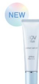
日中用保護クリーム